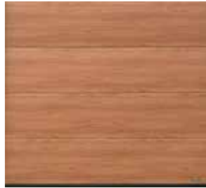
20 Noce sorrento natur