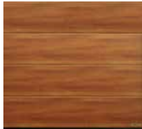
30 Saksanpähkinä Kolonial