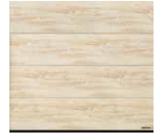
26 Used Look