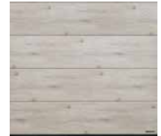
34 Whitewashed Oak