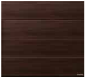
28 Saksanpähkinä Terra