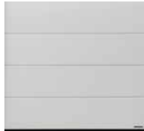
31 White brushed