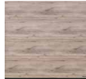
33 Whiteoiled Oak