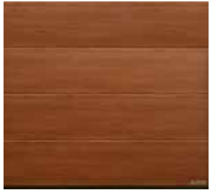
19 Noce sorrento balsamico