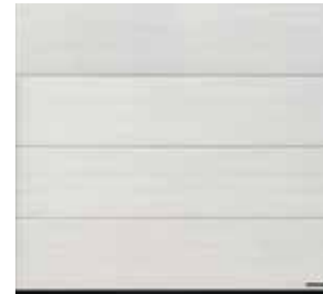
32 White Oak